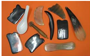
A collection of instruments used for gua sha treatment. The black tools are made of polished buffalo horn, which makes superior instruments. This is because buffalo horn in traditional Chinese medicine has a cold property and is therefore effective in dispelling heat factors from the body.

کشیدن این سنگها باید متناسب با وضعیت فیزیکی بیمار و در مسیر مریدینها صورت پذیرد. و پس از آن موضع را پاک کرده و بیمار مرخص می شود.