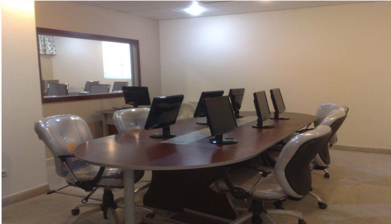
اتاق جانبی برای برگزاری Small Groups